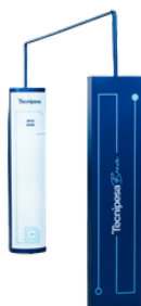
Arcos y portales RFID